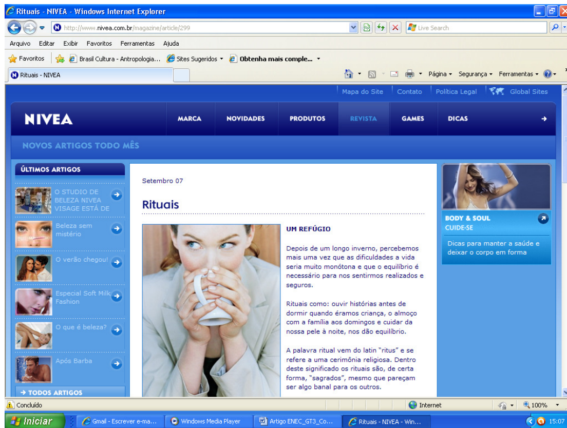
Figura 3 – http://www.nivea.com.br/magazine/article/299

Frases como “manter um ritual de beleza é parte da vida de muitas mulheres” é comum em matérias sobre beleza. Esta vem de uma edição especial da Revista Época sobre mulheres. Numa busca pela palavra ritual no oráculo dos nossos dias – Google – um dos maiores representantes de mais um elemento mágico da sociedade contemporânea, a Internet – localizamos 585.000 ocorrências. Se associarmos a palavra ritual à beleza, as ocorrências são 456.000. Impressionante ver como esses dois termos estão associados atualmente. O mesmo acontece com a palavra magia, com 1.400.000 ocorrências e, quando associada à beleza, 634.000 ocorrências – quase metade delas.