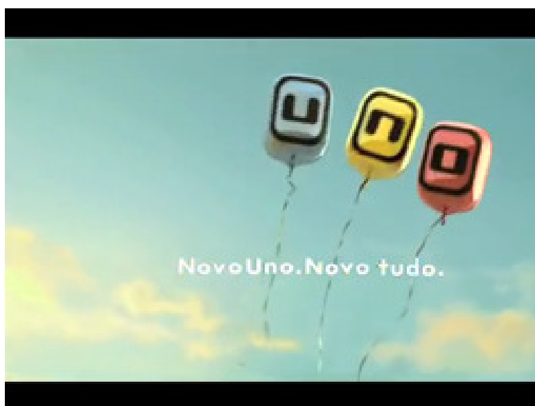
Figura 2 – www.adnews.com.br/lerrss.php?id=103448

E essa marca da primeira vez continua presente nas mensagens publicitárias, como na campanha da Vivo do primeiro BlackBerry, e ainda no apelo constante à mudança, à experiência do novo, discurso característico da publicidade. Algumas vezes o nome novo passa a integrar não só a narrativa acerca daquele produto, como também a própria forma como o produto se denomina. Recentemente a Fiat lançou o Novo Uno. Sua campanha publicitária tem um sugestivo nome de Cidade Mágica, onde o Novo Uno tem o poder de transformar tudo ao seu redor. Esse poder mágico atribuído ao novo carro pode ser transferido aos seus futuros consumidores, que terão o Novo Uno, que proporciona uma transformação, traduzida pelo Novo Tudo, presente na assinatura da campanha. Segundo a Fiat, o lançamento precisava fazer apelo às grandes mudanças do produto, por isso o comercial tenta passar o sentimento de transformação, sentimento do novo.